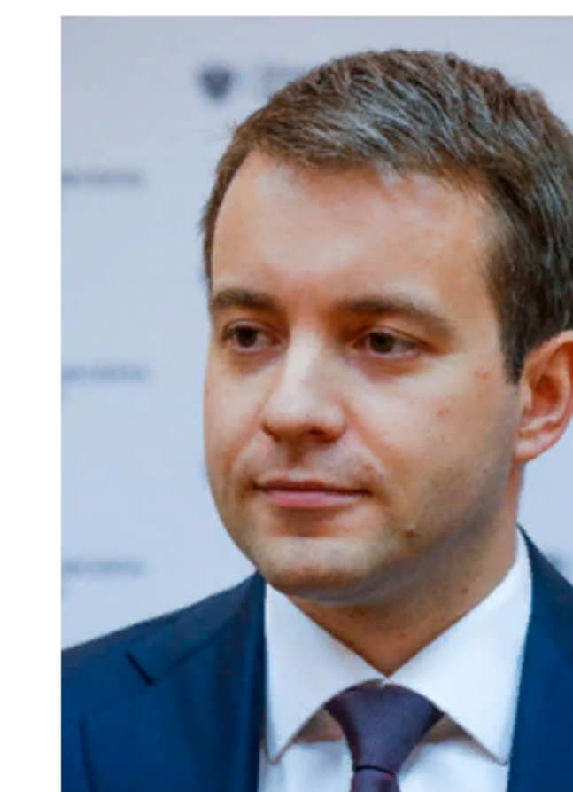
Никифоров Николай Анатольевич Министр связи и массовых коммуникаций Российской Федерации, сопредседатель Организационного комитета Всероссийской акции "Стоп ВИЧ/СПИД"