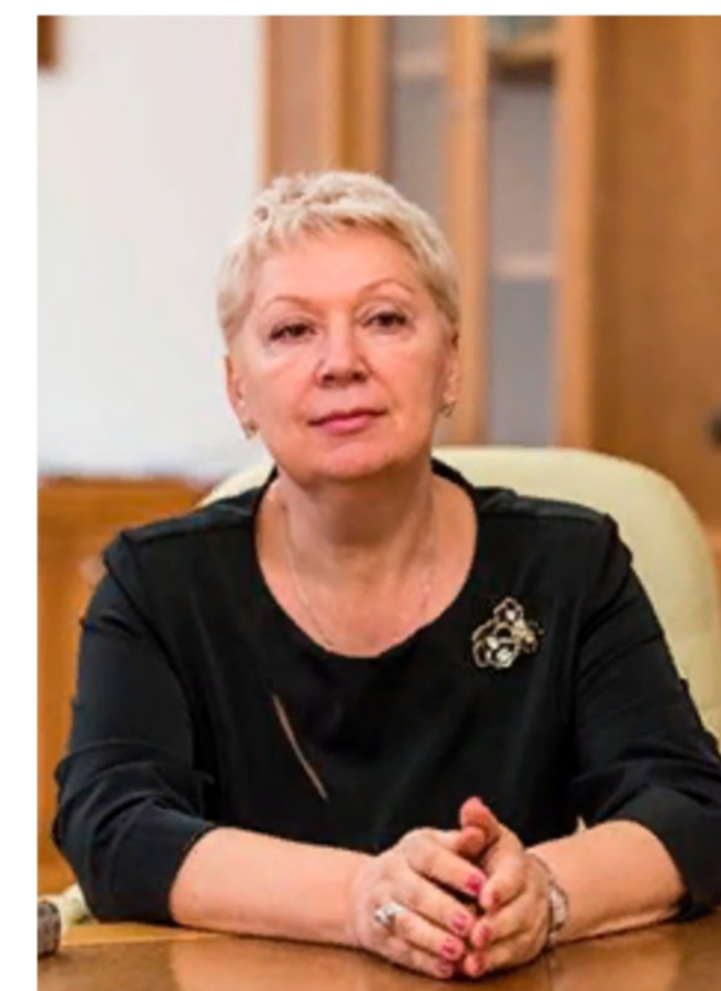
Васильева Ольга Юрьевна

Министр образования и науки Российской Федерации, сопредседатель Организационного комитета Всероссийской акции "Стоп ВИЧ/СПИД"