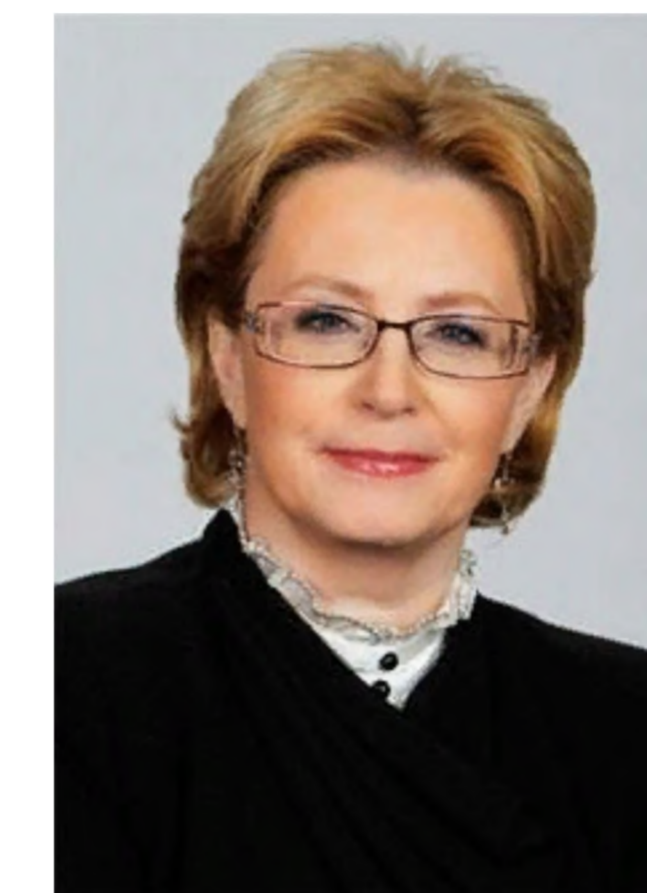
Скворцова Вероника Игоревна Министр здравоохранения Российской Федерации, сопредседатель Организационного комитета Всероссийской акции "Стоп ВИЧ/СПИД"